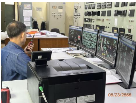
ภาพที่ 2.2-32 Control Room