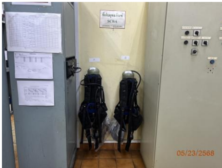
ภาพที่ 2.2-43 อุปกรณ์ SCBA เครื่องช่วยหายใจ