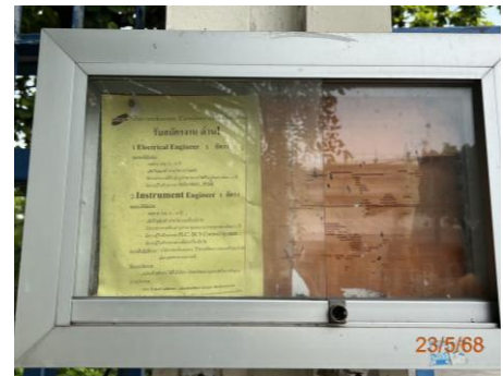
ภาพที่ 2.2-18 ป้ายประกาศรับสมัครงาน