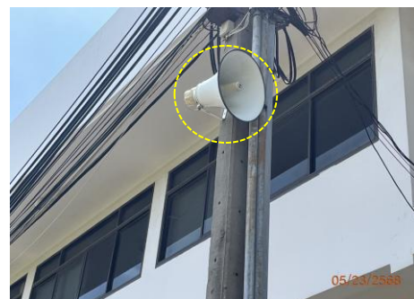
ภาพที่ 2.2-35 ลำโพงแจ้งเตือนเสียงตามสาย