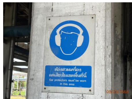
ภาพที่ 2.2-8 ป้ายเตือนการสวมใส่ อุปกรณ์ป้องกันเสียง