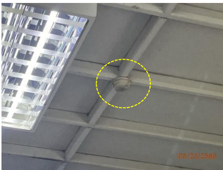
ภาพที่ 2.2-37 ระบบตรวจจับความร้อน (Heat Detector) บริเวณพื้นที่ Store