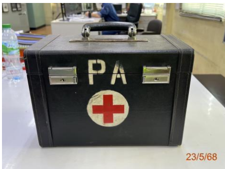
ภาพที่ 2.2-20 เวชภัณฑ์ปฐมพยาบาลเบื้องต้น