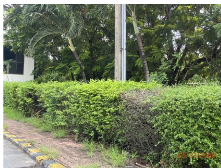
ภาพที่ 2.2-48 (ต่อ)