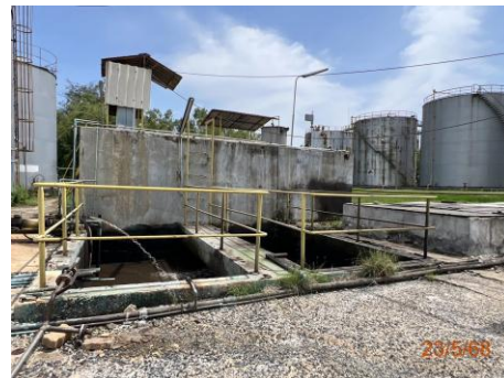
ภาพที่ 2.2-4 ระบบบำบัดน้ำเสีย