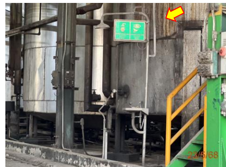
ภาพที่ 2.2-21 อ่างล้างตาและฝักบัวฉุกเฉิน