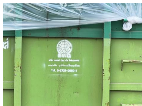
บริษัท เบตเตอร์ เวิลด์ กรีน จำกัด (มหาชน) Tel. 0-2731-0080-1