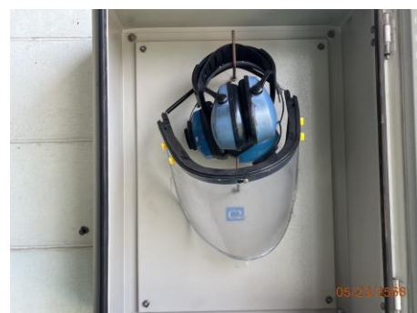
ภาพที่ 2.2-9 การจัดเตรียม Ear Muffs ไว้บริเวณหน้างาน