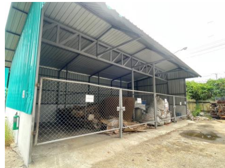
ภาพที่ 2.2-16 โรงเก็บขยะมีมูลค่า