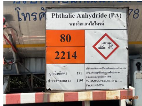
รถขนส่งสารเคมี ของ บริษัท คอนทินเนนทอล ปีโตรเคมีคอล (ประเทศไทย) จำกัด