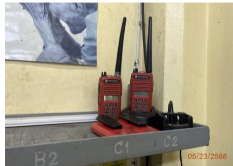
ภาพที่ 2.2-46 วิทยุสื่อสาร Walkie Talkie