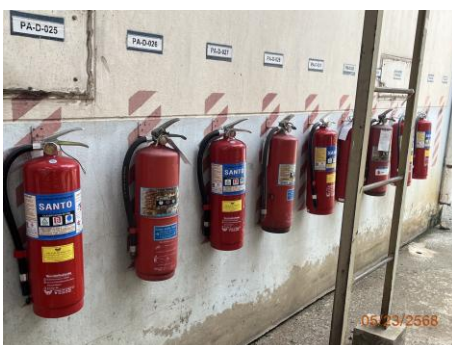
ภาพที่ 2.2-41 ถังเคมีดับเพลิง