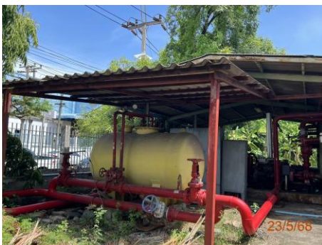
ภาพที่ 2.2-39 แนวท่อน้ำดับเพลิง และแนวท่อโหมดับเพลิง