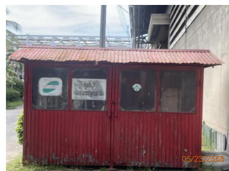
ภาพที่ 2.2-42 ตู้เก็บชุดผจญเพลิง ด้านหน้าอาคาร Ware House