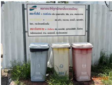
ภาพที่ 2.2-17 ถังขยะแยกประเภท