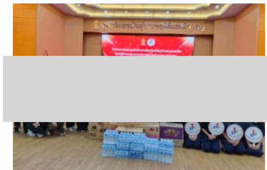
ร่วมโครงการรณรงค์ประชาสัมพันธ์ต่อต้านยาเสพติดในหมู่บ้าน/ชุมชนเขตเทศบาลบางเสาธง ณ โรงเรียนบดินทร์เดชา (สิงห์ สิงหเสนี) สมุทรปราการ วันที่ 18 มิถุนายน 2568