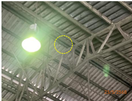
ภาพที่ 2.2-36 ระบบตรวจจับควัน (Smoke Detector) บริเวณพื้นที่อาคาร Ware House