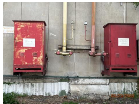
ภาพที่ 2.2-40 ตู้เก็บอุปกรณ์ดับเพลิง