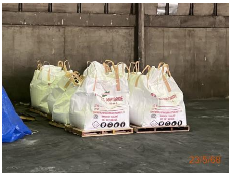
ภาพที่ 2.2-3 เกล็ด PA ที่รวบรวมเพื่อนำ กลับไปผลิตเป็นผลิตภัณฑ์อีกครั้ง