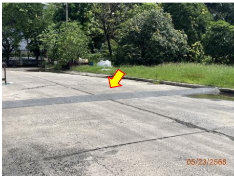
ภาพที่ 2.2-12 แนวป้องกัน Curb