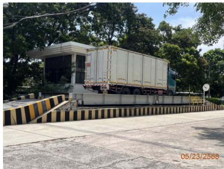
ภาพที่ 2.2-5 ตราชั่งน้ำหนักรถบรรทุก