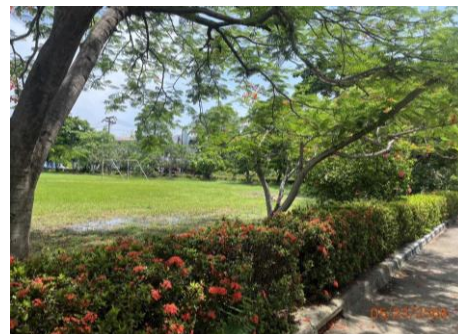
ภาพที่ 2.2-48 พื้นที่สีเขียวภายในบริเวณโรงงาน