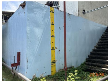
ภาพที่ 2.2-38 บ่อน้ำสำรองดับเพลิง