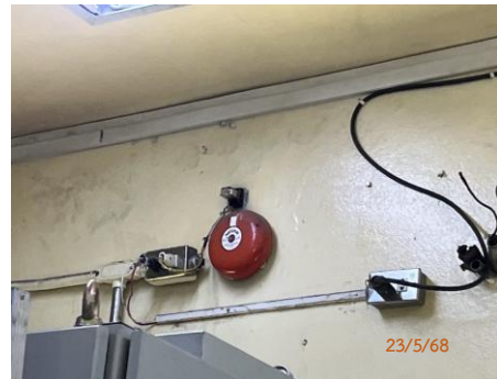
ภาพที่ 2.2-44 สัญญาณเสียงเตือนเหตุเพลิงไหม้ (Fire Alarm)