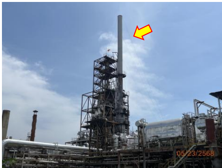
ภาพที่ 2.2-1 Waste Gas Scrubber