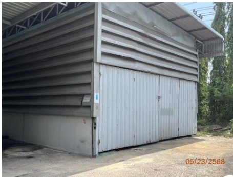
ภาพที่ 2.2-15 โรงเก็บขยะอันตราย