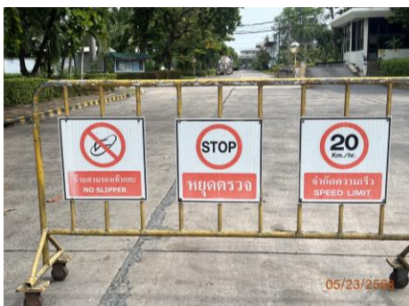
ภาพที่ 2.2-7 ป้ายควบคุมความเร็วไม่เกิน 20 กม./ชม.