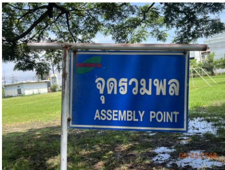
ภาพที่ 2.2-45 จุดรวมพล