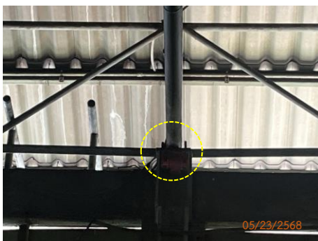
ภาพที่ 2.2-34 ไซเรนเสียงในอาคาร Ware House