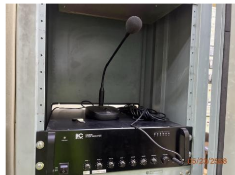
ภาพที่ 2.2-33 ระบบแจ้งเตือนเสียงตามสาย