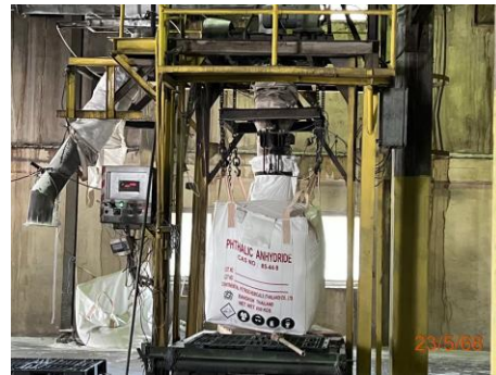
ภาพที่ 2.2-2 ระบบรวบรวมฝุ่น PA และ De-dusting Filter