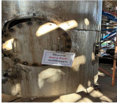
ภาพที่ 2.2-29 บริเวณสถานที่อับอากาศ