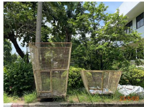
ภาพที่ 2.2-13 การตัดแยกขวดน้ำพลาสติก