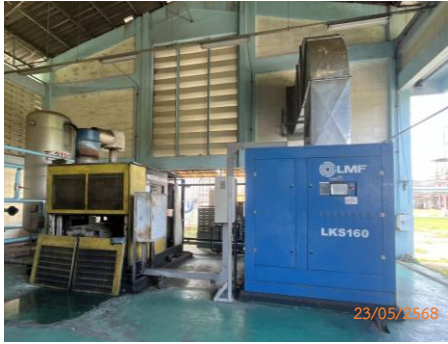
ภาพที่ 2.2-10 บริเวณ Air Compressor ที่ติดตั้งไว้ในอาคาร