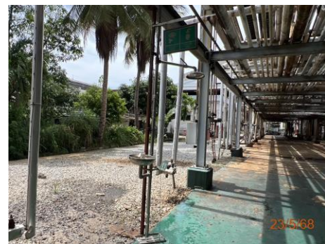
ภาพที่ 2.2-31 หินเกล็ดรอบพื้นที่เสี่ยงเพลิงไหม้