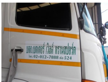
บริษัท เบตเตอร์ เวิลด์ ทรานสปอร์ต จำกัด Tel. 02-012-7888 ต่อ 524