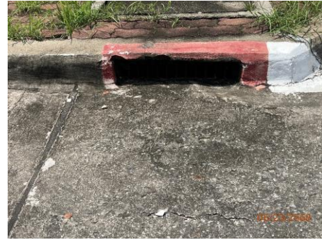
ภาพที่ 2.2-11 รางระบายน้ำฝนรอบพื้นที่โครงการ ที่ติดตั้งไว้ในอาคาร